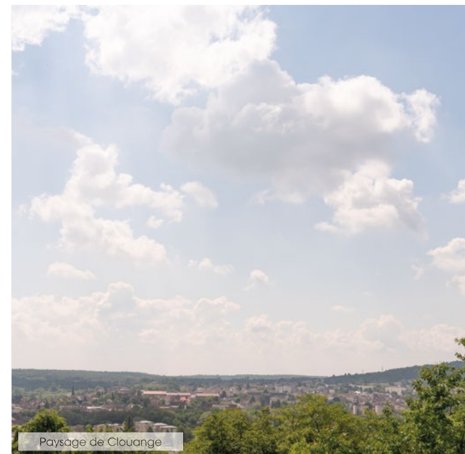
Paysage de Clouange