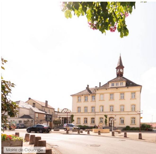
Mairie de Clouange