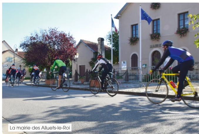
La mairie des Alluets-le-Roi