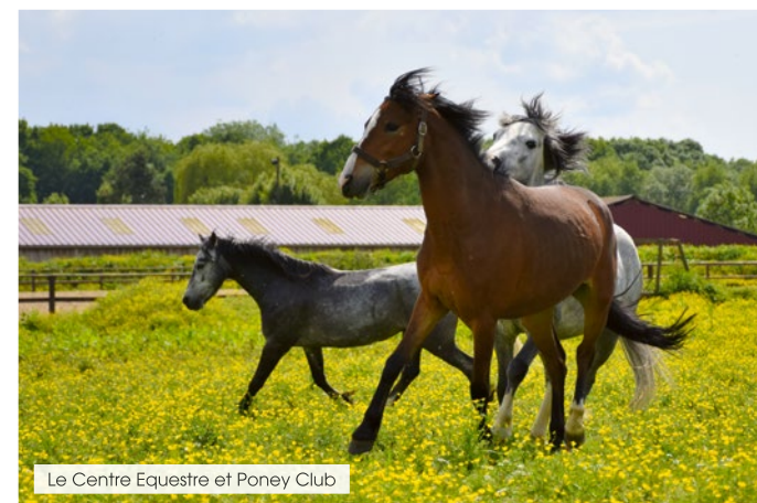
Le Centre Equestre et Poney Club