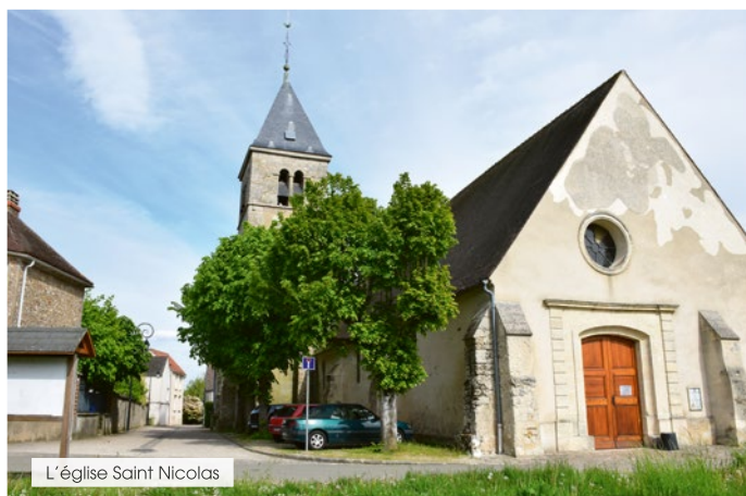
L'église Saint Nicolas