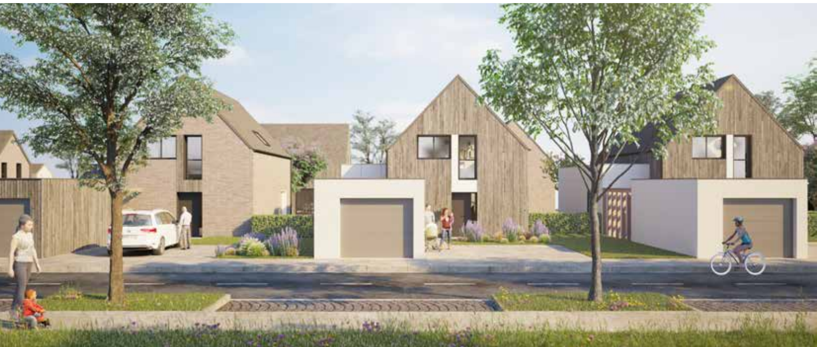
Le Clos de la Malterie, Baisieux

Notre filiale est née de la volonté du Groupe Villogia de professionnaliser et de spécialiser les métiers de l'accession à la propriété.