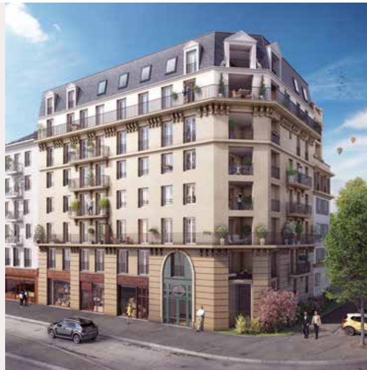
Grande Avenue, Blanc-Mesnil

Garantir le bien-vivre ensemble des copropriétaires à un coût maîtrisé . Apporter une valeur ajoutée axée sur le conseil et l'expertise.