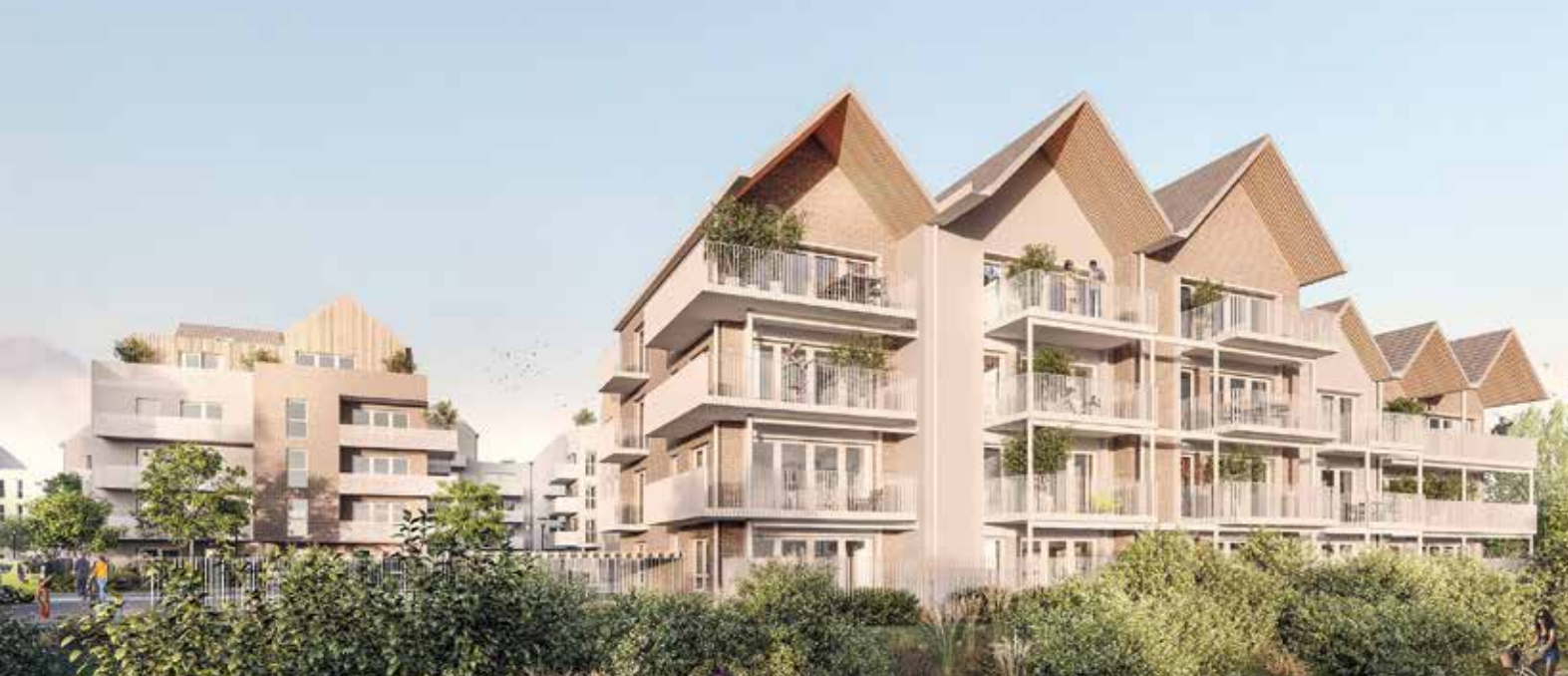
Les Quais, Wambrechies