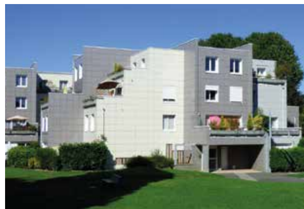
Résidence Colombier, Villeneuve d'Ascq

Nous possédons une solide expérience en gestion de copropriétés, avec à notre actif plus de 200 ensembles immobiliers représentant 11 000 lots sur la métropole lilloise et en Île-de-France .