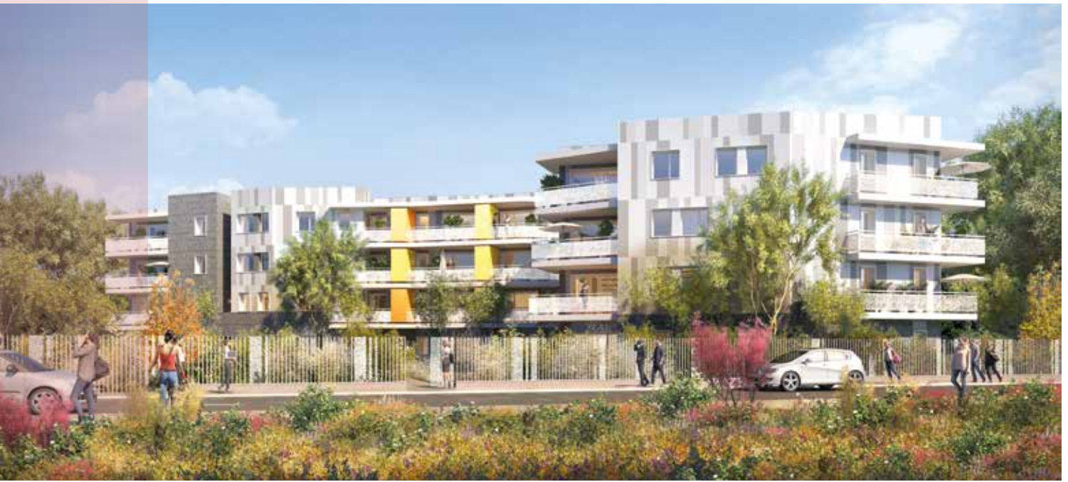
Grandes ondes, Tremblay