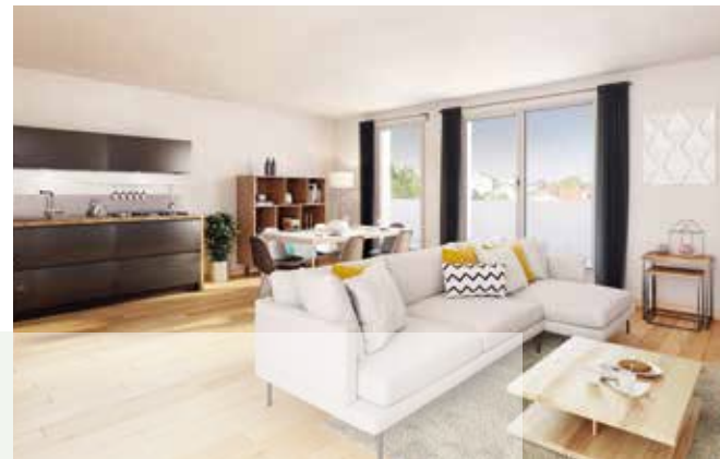
Résidence Mirabeau, Romainville

Nous avons développé ce savoir-faire depuis de nombreuses années, basé sur de nombreuses réalisations de programmes de logements . Nos collaborateurs sont de véritables experts en immobilier neuf, maîtrisant tous les aspects de la commercialisation de produits spécifiques à l'accès maîtrisé : BRS, PSLA, en zones ANRU ou en QPV.