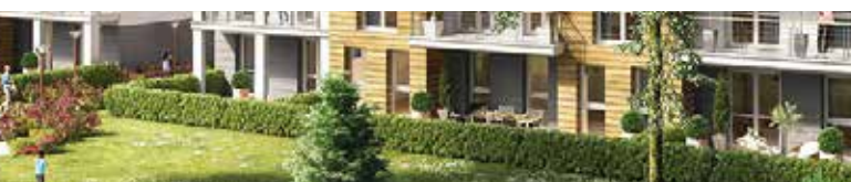
Les Jardins Debussy, Magny-les-Hameaux