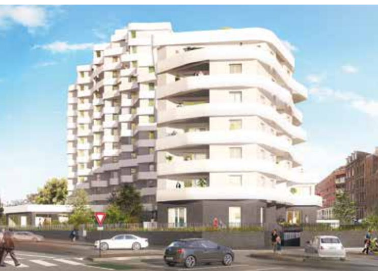
City'Art, Lille centre

— LA COMMERCIALISATION Fixation du prix de vente, mise en place du plan d'action commercial, commercialisation des logements, suivi des contrats, livraison et reporting grâce à notre extranet client.