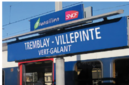
Gare de Tremblay - Villepinte