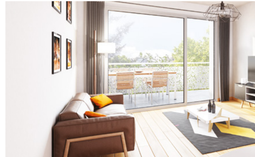
Exemple d'aménagement intérieur