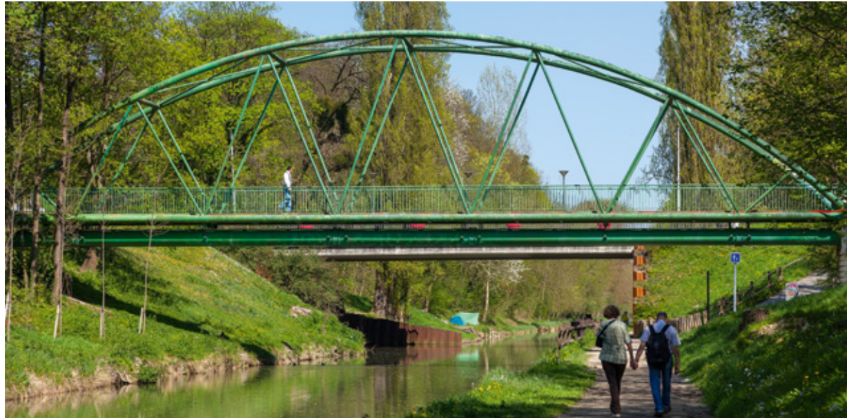
Canal de l'Ourcq