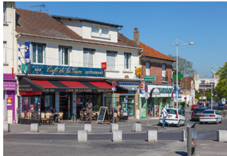
Place de la Gare