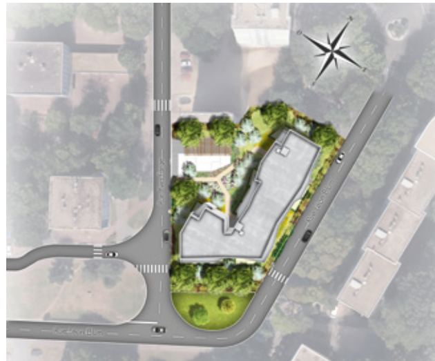
Plan de l'ensemble immobilier

Dès le premier regard, « Grandes Ondes » s'affirme comme un signal au croisement de la rue Yves Farge et de la rue Léon Blum. L'architecture revendique ses influences contemporaines : au droit des halls, le soubassement recevra un parement de type pierre ciselée, manteau polychrome alternant quatre tonalités de gris sur les niveaux supérieurs, balcons filants aux formes ondoyantes... Cet ensemble réparti sur 3 niveaux offre de beaux appartements du studio cocoon pour célibataire au 4 pièces familial.