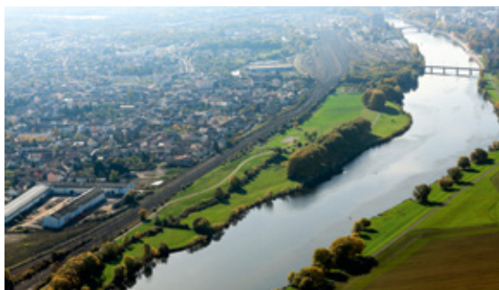
Vue sur la Moselle

Idéalement située au carrefour du Luxembourg et de la Moselle, Yutz est une commune en pleine mutation. Elle s'inscrit en effet dans la politique de développement de la Communauté d'Agglomération Portes de France-Thionville, deuxième pôle urbain de Moselle.